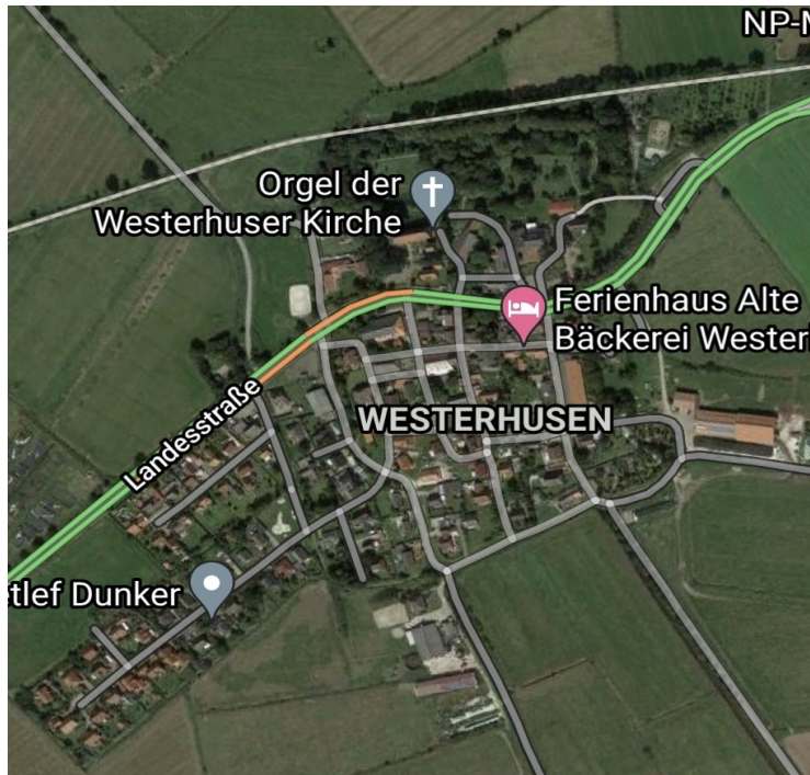
Lage im Dorf Westerhusen der Gemeinde Hinte an den Straßen: Polderweg-Landesstr.-Rundum.

Vor dem Bau der Kindertagesstätte Rundum war das Grundstück, auf welchem die Kita Rundum errichtet wurde, in drei Flächen unterteilt. Zum einen stand dort ein Mehrfamilienhaus, welches vor fünf Jahren die Energiezukunft Hinte, ein Tochterunternehmen der Gemeinde Hinte, gekauft hatte, um Schutzsuchende Personen dort unterzubringen. Daneben, auf dem zweiten Grundstück stand eine ehemalige Kohlenhalle, vom früheren Kohlehändler. Das dritte Grundstück war eine Schotterfläche, welche kurzzeitig von einem Autohändler genutzt wurde, um Autos zu verkaufen. Diese drei Grundstücke sind baurechtlich zu einem Grundstück zusammengeführt worden, damit darauf die neue Kindertagesstätte entstehen konnte.